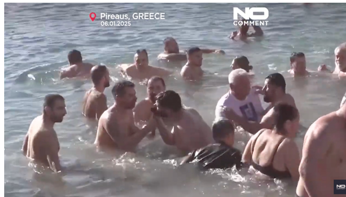
Orthodox faithful in Greece swim to retrieve the cross on Epiphany https://www.youtube.com/watch?v=9cqBZmSOiSg