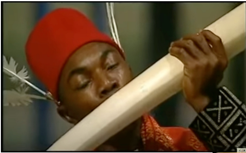
SHOFAR in Jerusalem https://youtu.be/9dkEe3ph_bU?si=CKuBTxVjjsOLRvkj