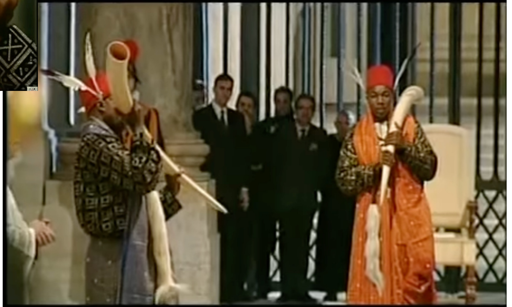
Magnum Jubilaeum A. D. 2000 - Apertura della Porta Santa [II] https://youtu.be/mi8rdZ978-8?si=SCw2_xuW1I2J59VE&t=210