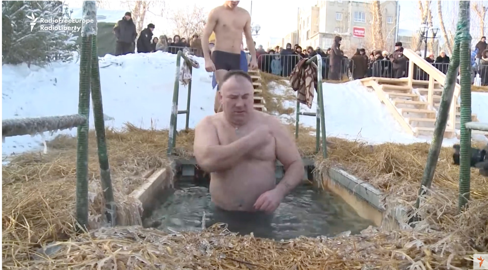
Orthodox Christians Celebrate Epiphany With Icy Plunges https://youtu.be/z0ZcWp07eYU?si=ZdUY_yuNWkzmcQTy