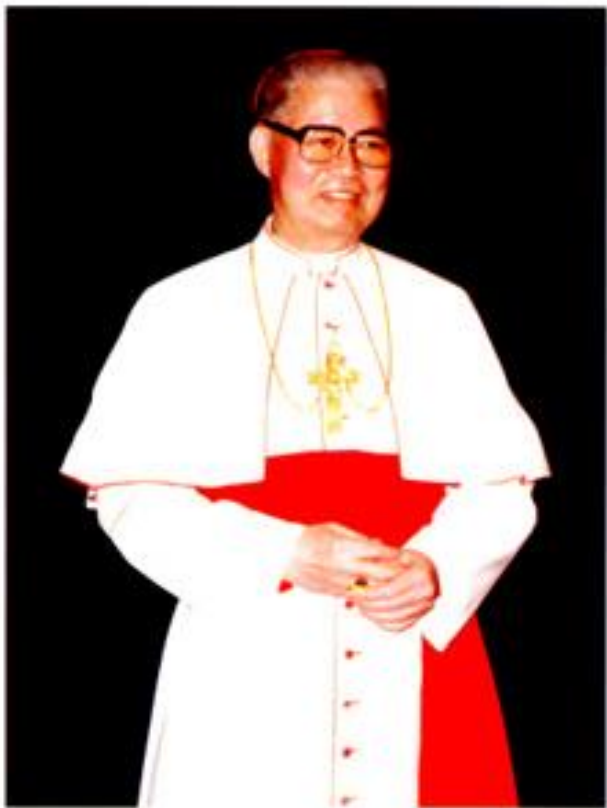
香港教區第五任主教 胡振中樞機