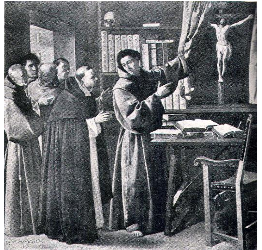
Bonaventure (聖文德1221-1274) showing The Crucifix to Thomas Aquinas (聖多瑪斯 • 亞奎納1224-1274)