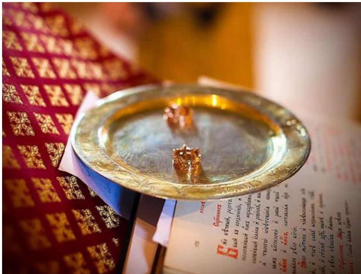
放在盤中等待祝福的婚戒

https://catalog.obitel-minsk.com/blog/2018/01/why-on-right-hand-meaning-of-rings-in