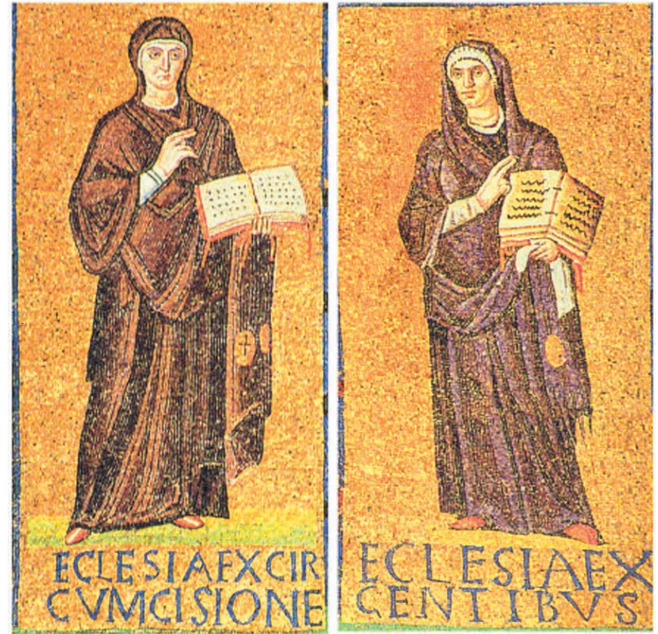
羅馬 Santa-Sabina (五世紀馬賽克)

伯多祿便對他們說：「你們悔改罷！你們每人要以耶穌基督的名字受洗，好赦免你們的罪過，並領受聖神的恩惠。因為這恩許就是為了你們和你們的子女，以及一切遠方的人，因為都是我們的上主天主所召叫的。」(宗 2:38-39)