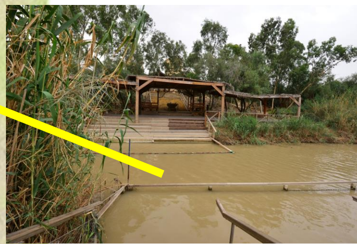
若1:28 這些事發生於約但河對岸的伯達尼，若翰施洗的地方。