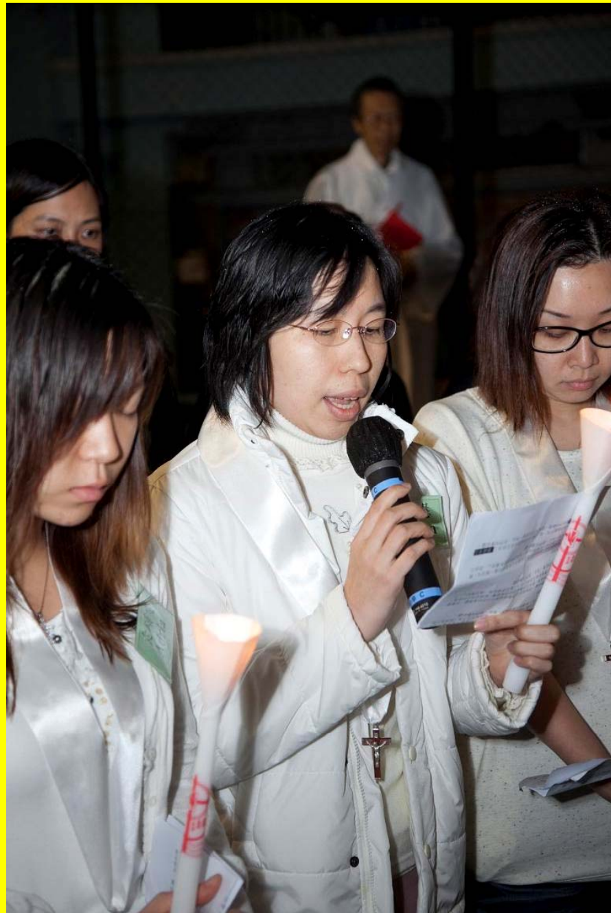
新教友代表作出信友禱文