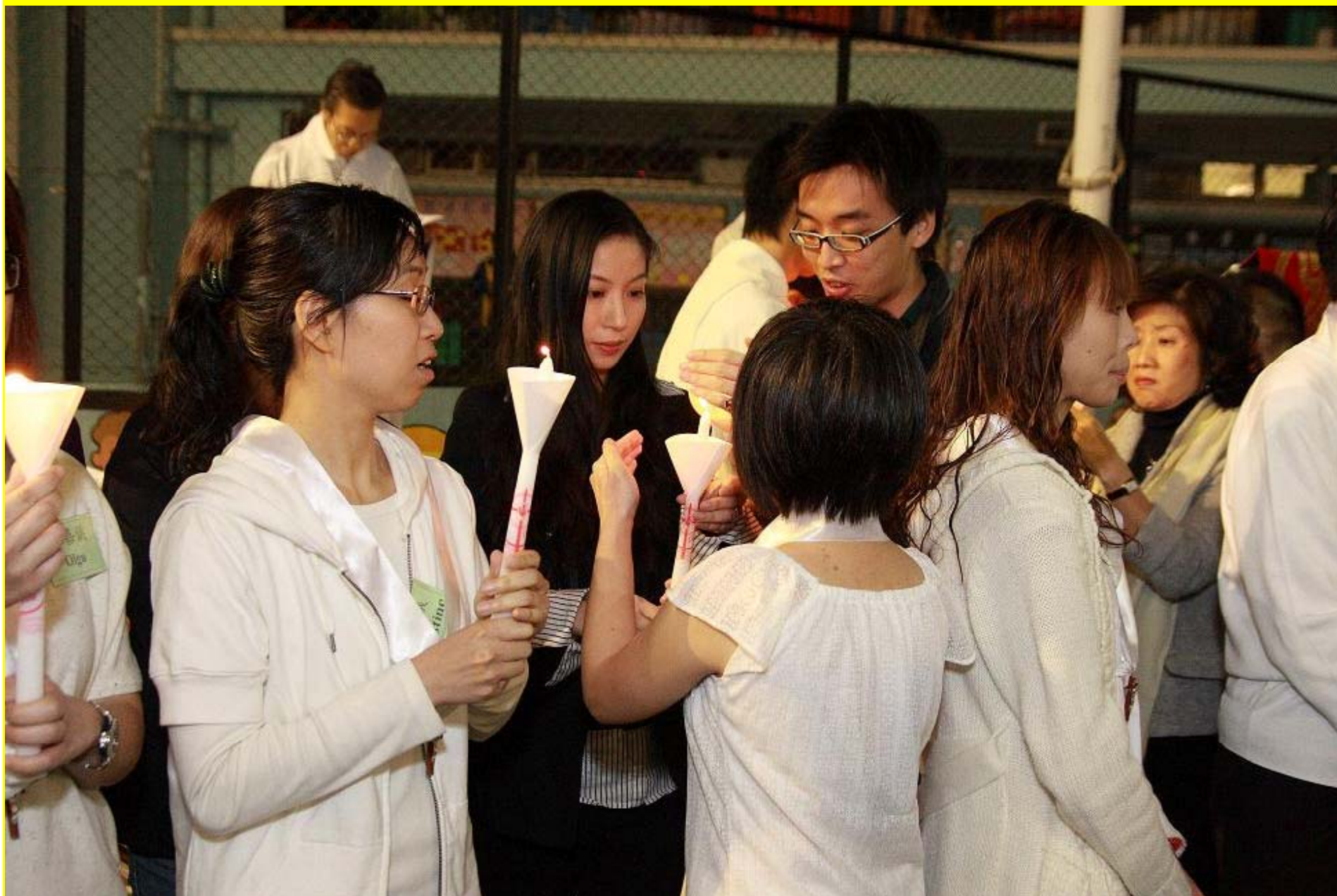
代父母將基督的光交給代子女