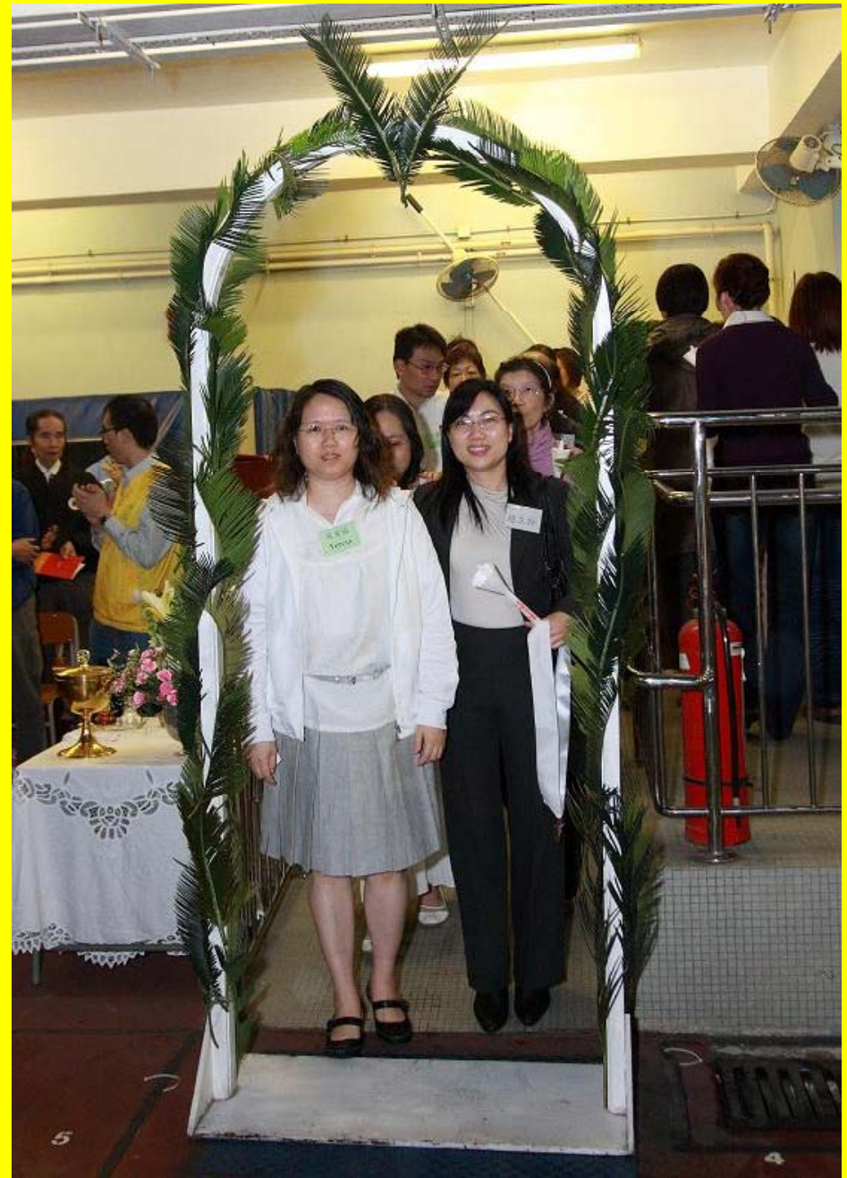
入門：進入聖神內的新生命