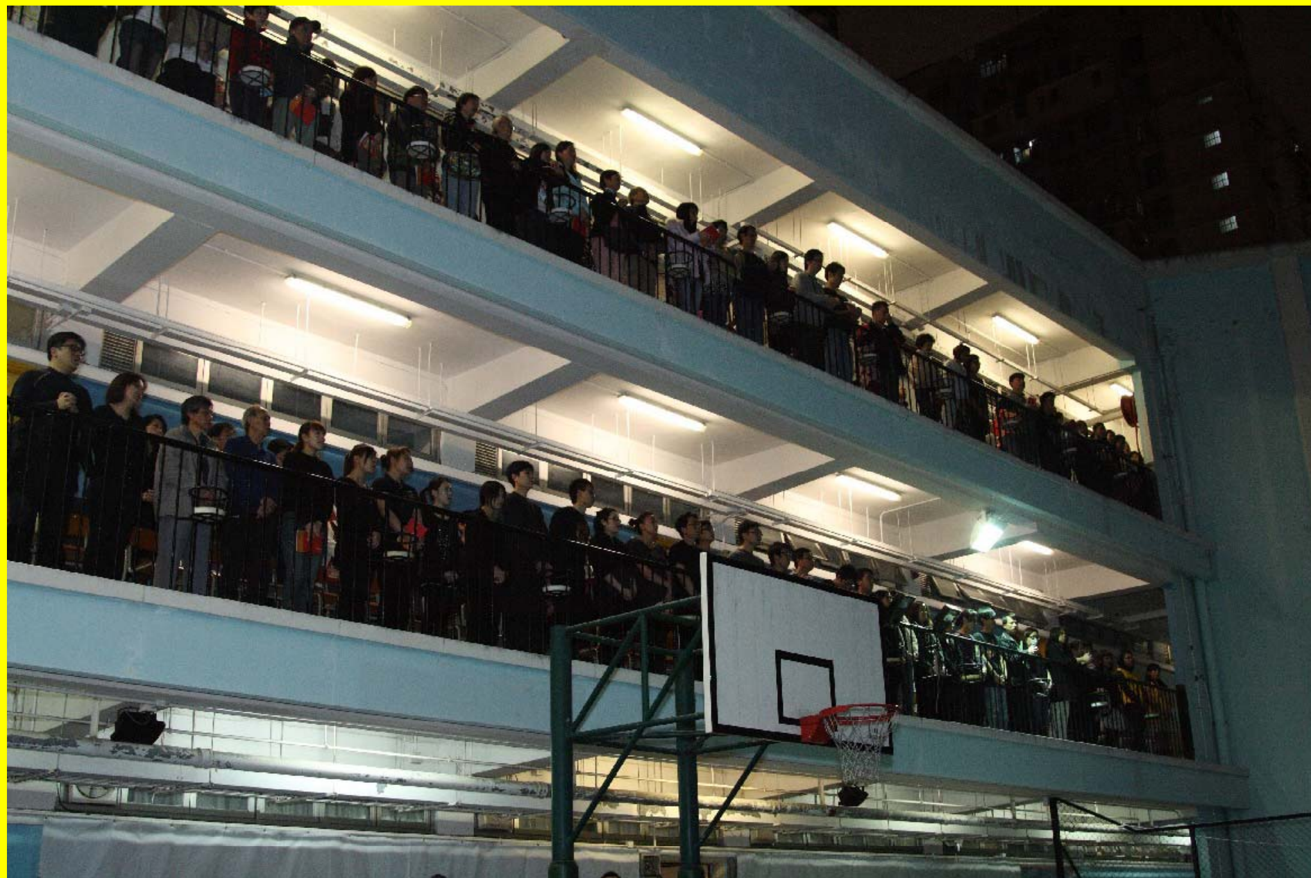
候洗者（在籃球架後）等待入門聖事