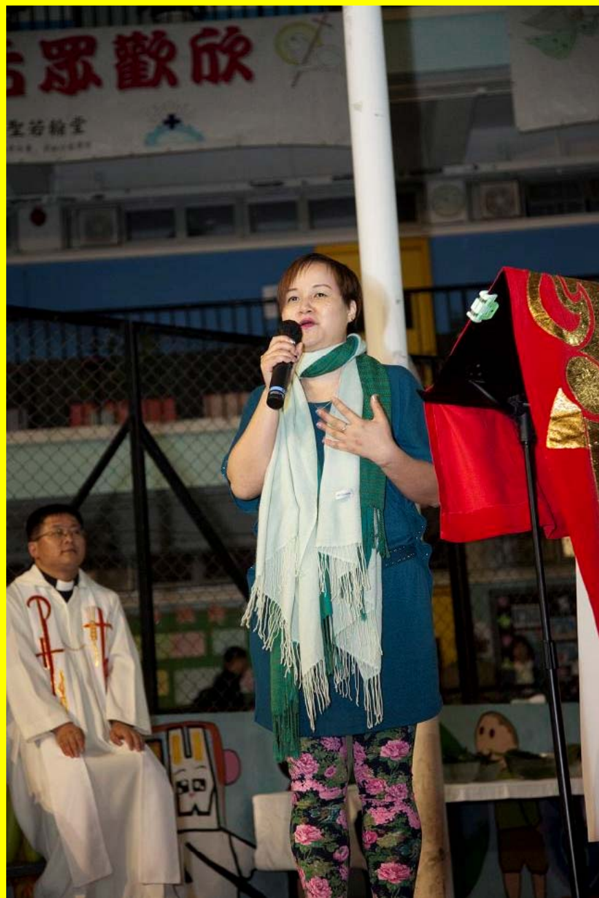
堂區議會會長致歡迎辭