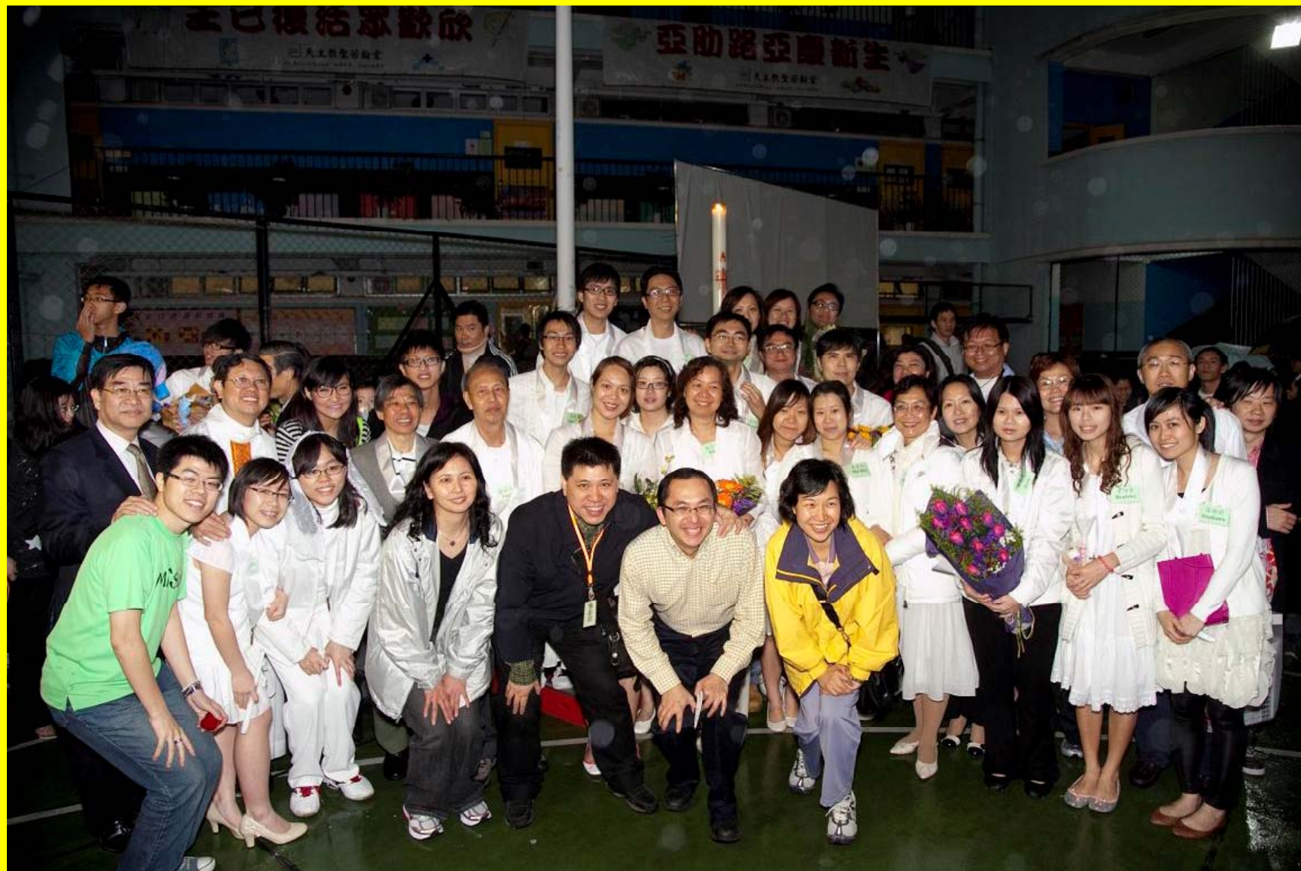
禮成新教友與神父及導師合照