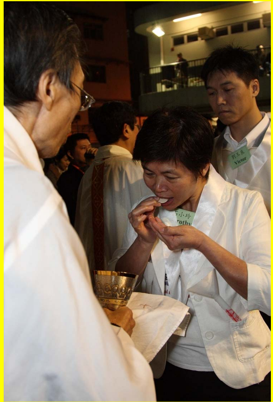
新教友領受共融聖事（聖體聖血）