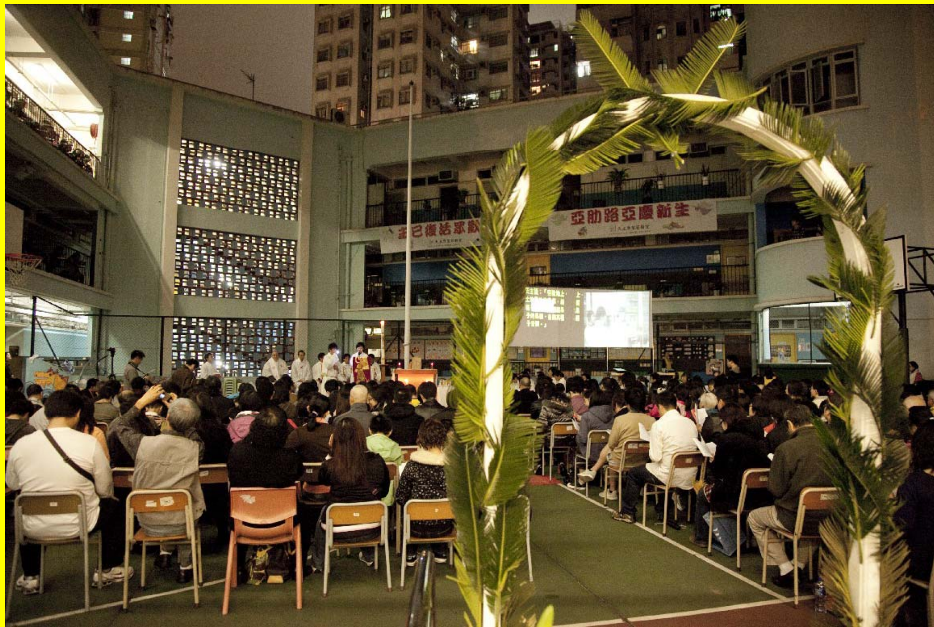
聖道禮：恭讀創世紀