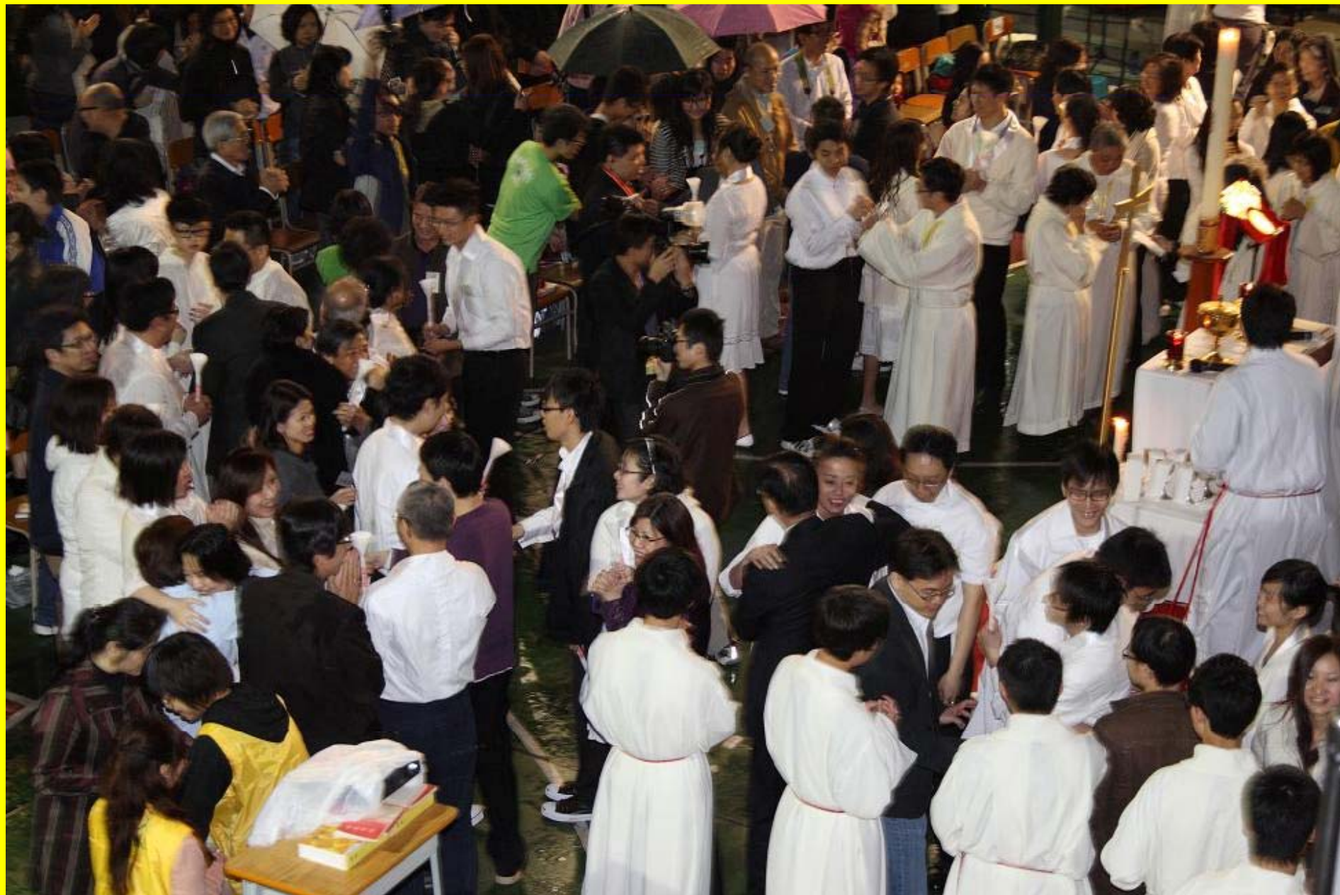
互祝復活主的平安