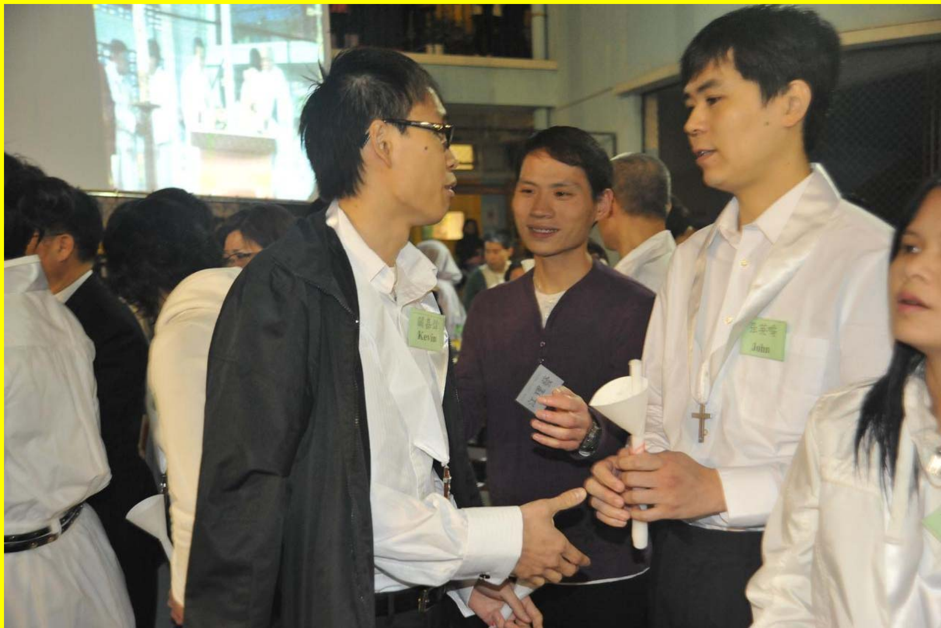
互祝復活主的平安