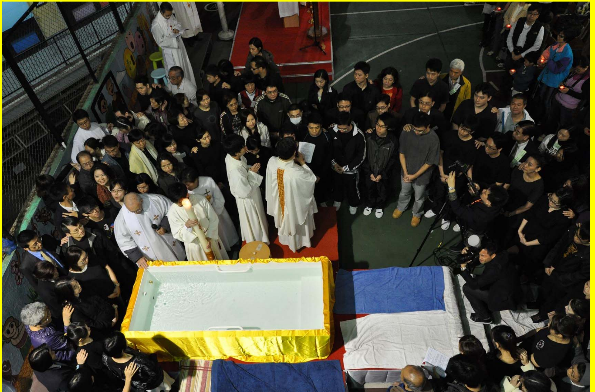
候洗者（穿黑衣）棄絕罪惡、宣認信仰