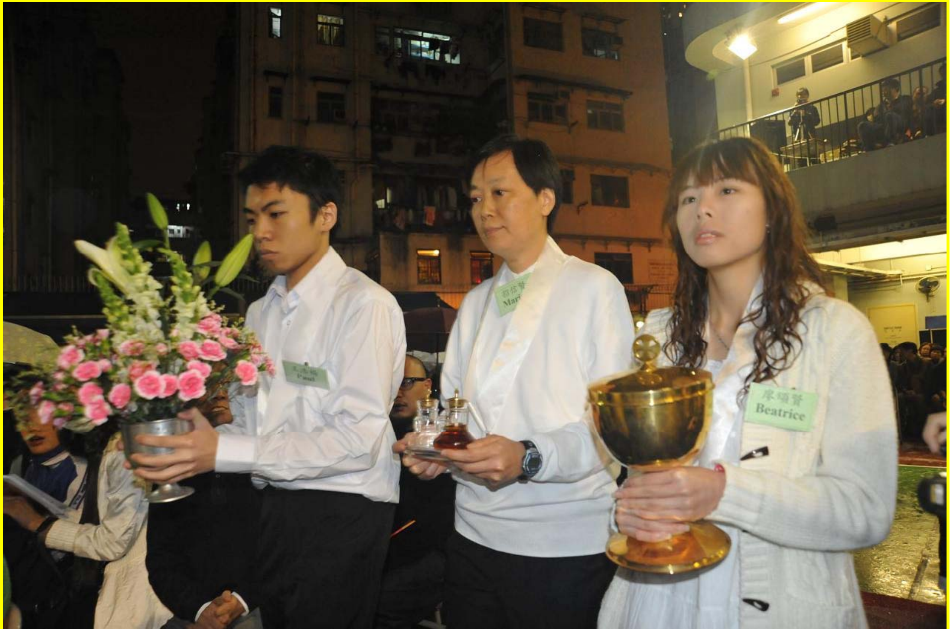
新教友代表呈上餅酒