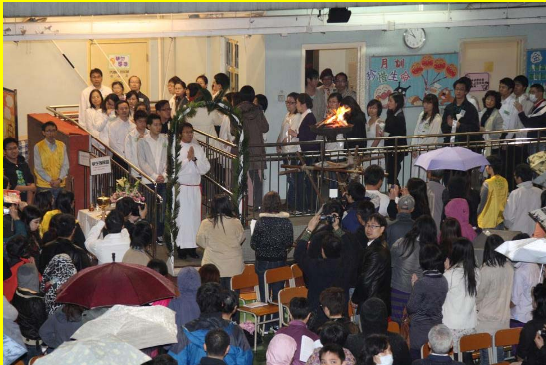
洗禮後新教友與代父母進場