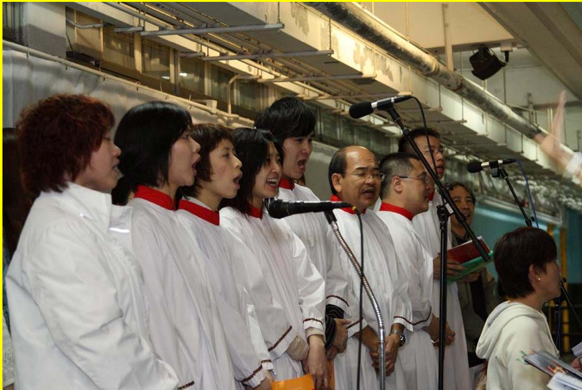
阿肋路亞，主已復活