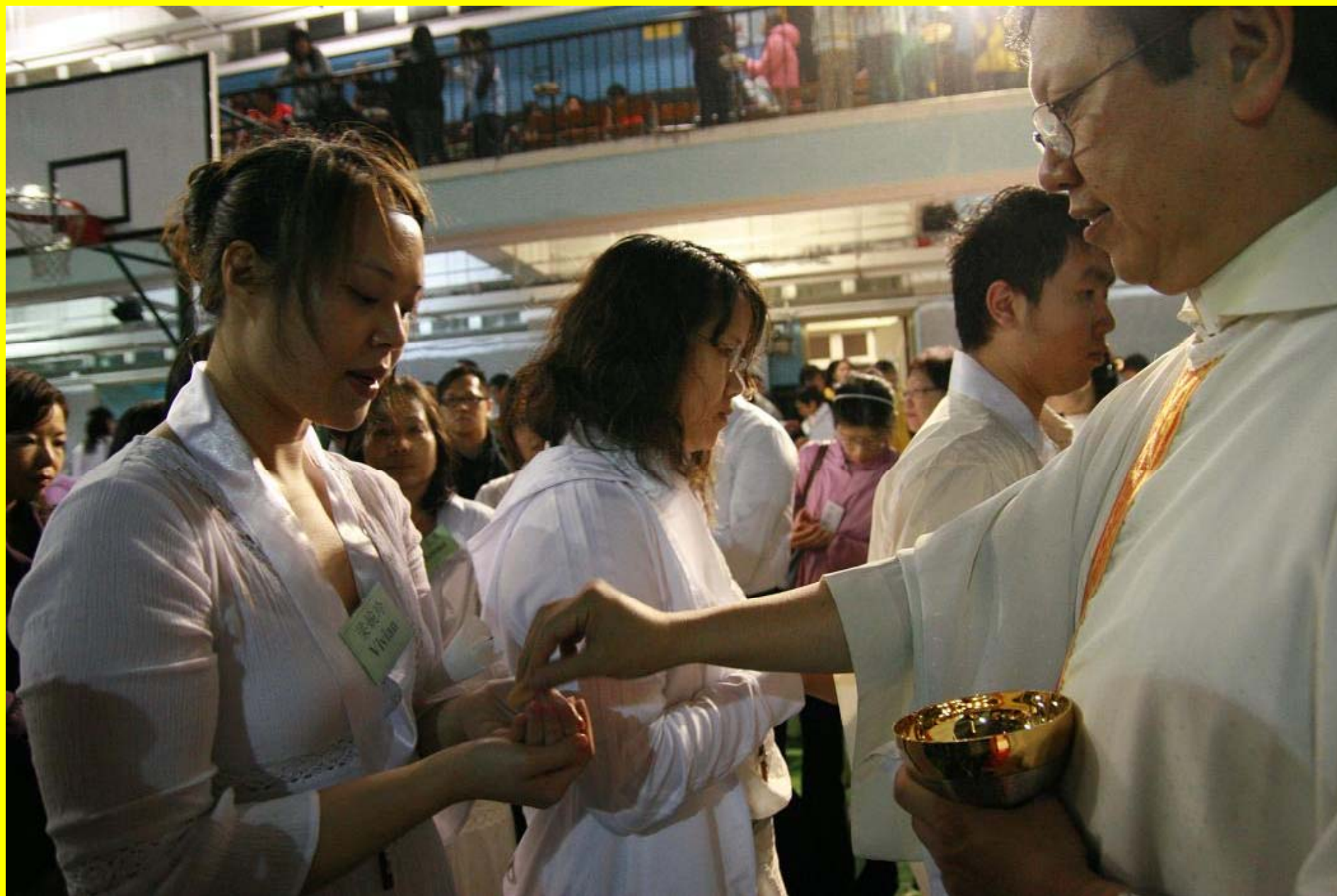
新教友領受共融聖事（聖體聖血）