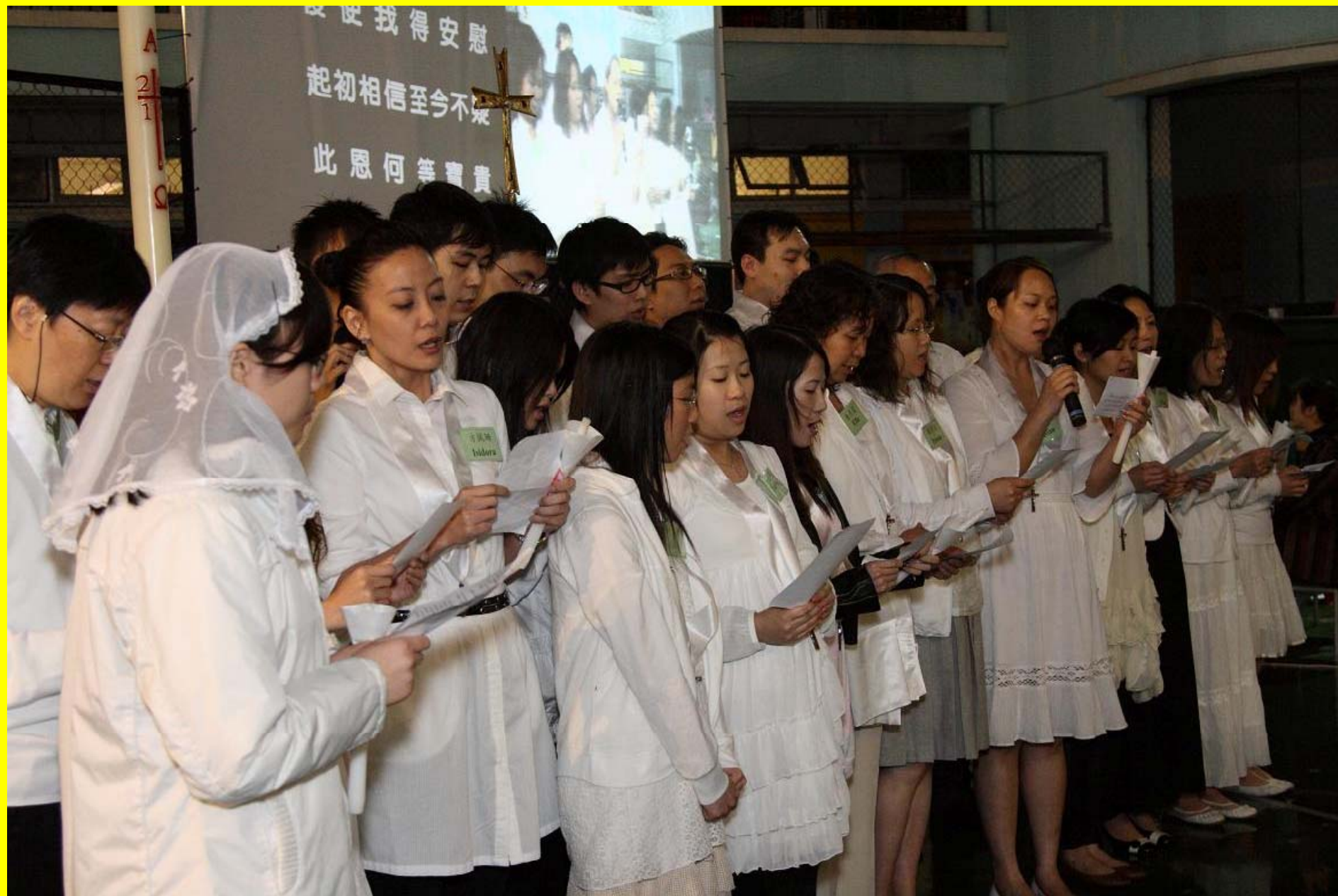
新教友獻唱：奇妙救恩